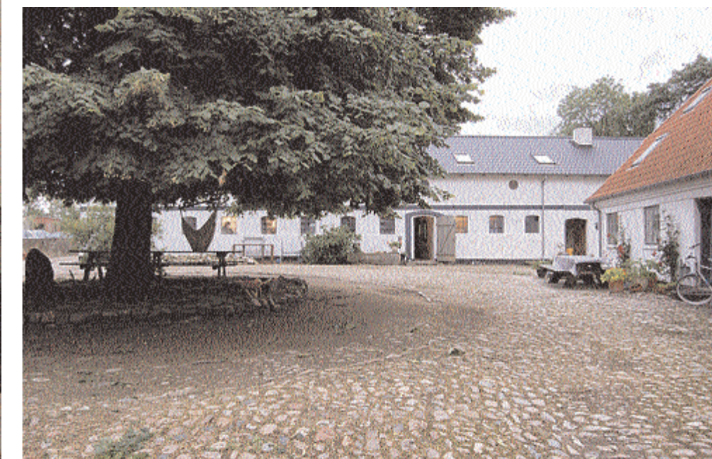
Ellegaarden er en gammel Hærvejskro. I stalden i baggrunden er der nu musikcafe og spiselokaler.