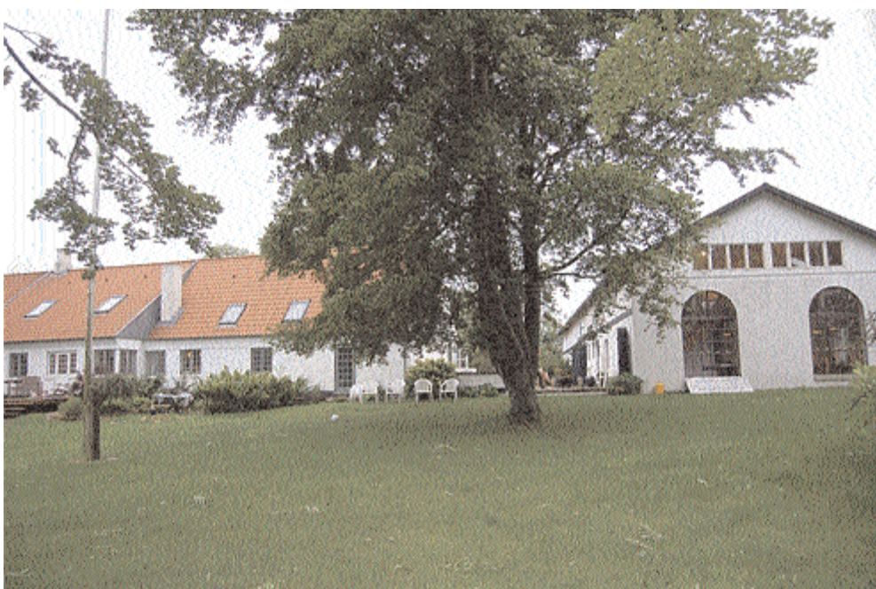
I den ene ende af den gamle stald (til højre), hvor der tidligere var grisesti og haloft, er der indrettet spisecafe med udsigt ud over parken, hvor Jels Å slynger sig. Vinduerne er fra et nedrevet slagteri i Kolding.