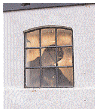
Fra gårdpladsen ses skyggerne af musikerne, der optræder i stalden.