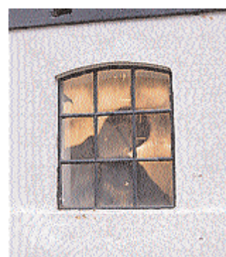
Fra gårdspladsen ses skyggerne af musikerne, der optræder i stalden.